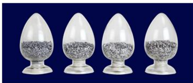
航空航天级特种中间合金

航空航天级高品质钛合金和高温合金用中间合金是公司主要研发的产品之一，包括以钒铝、钼铝等为代表的二元合金和以钒铝锡铬、铝钼钒铬铁等为代表的多元合金。公司目前已投资完成了国内领先的特种中间合金生产线建设，公司现有装备水平、技术能力和产品质量均位列国内前列。尤其是技术含量高，开发难度大，市场潜力大的系列多元合金的研制成功，使公司的技术实力和市场开发能力有了进一步的提升。客户采用本公司独立研发的多元合金已成功用于制作航空航天发动机排气塞、喷嘴构件以及紧固件等关键部件，产品质量已通过验证，公司航空航天级特种中间合金产品技术质量水平达到了世界先进。