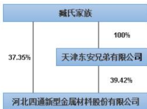
截止 2019 年 12 月 31 日的产权及控制关系方框图